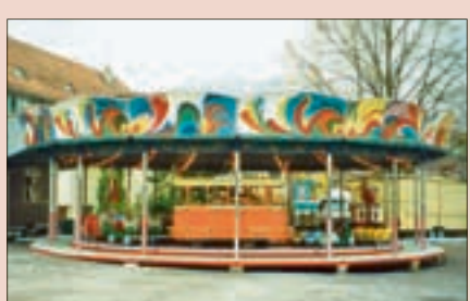
Seite 11. Attraktionen am Herisauer Jahrmarkt