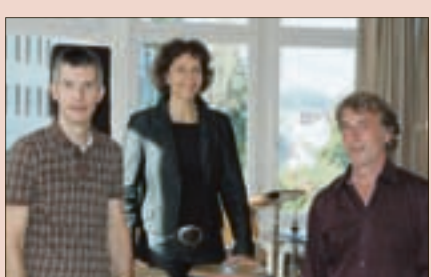
Seite 11. Zusammenarbeit der Musikschulen wird gestärkt