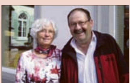
Seite 3. Etavis Grossenbacher AG feiert Jubiläum